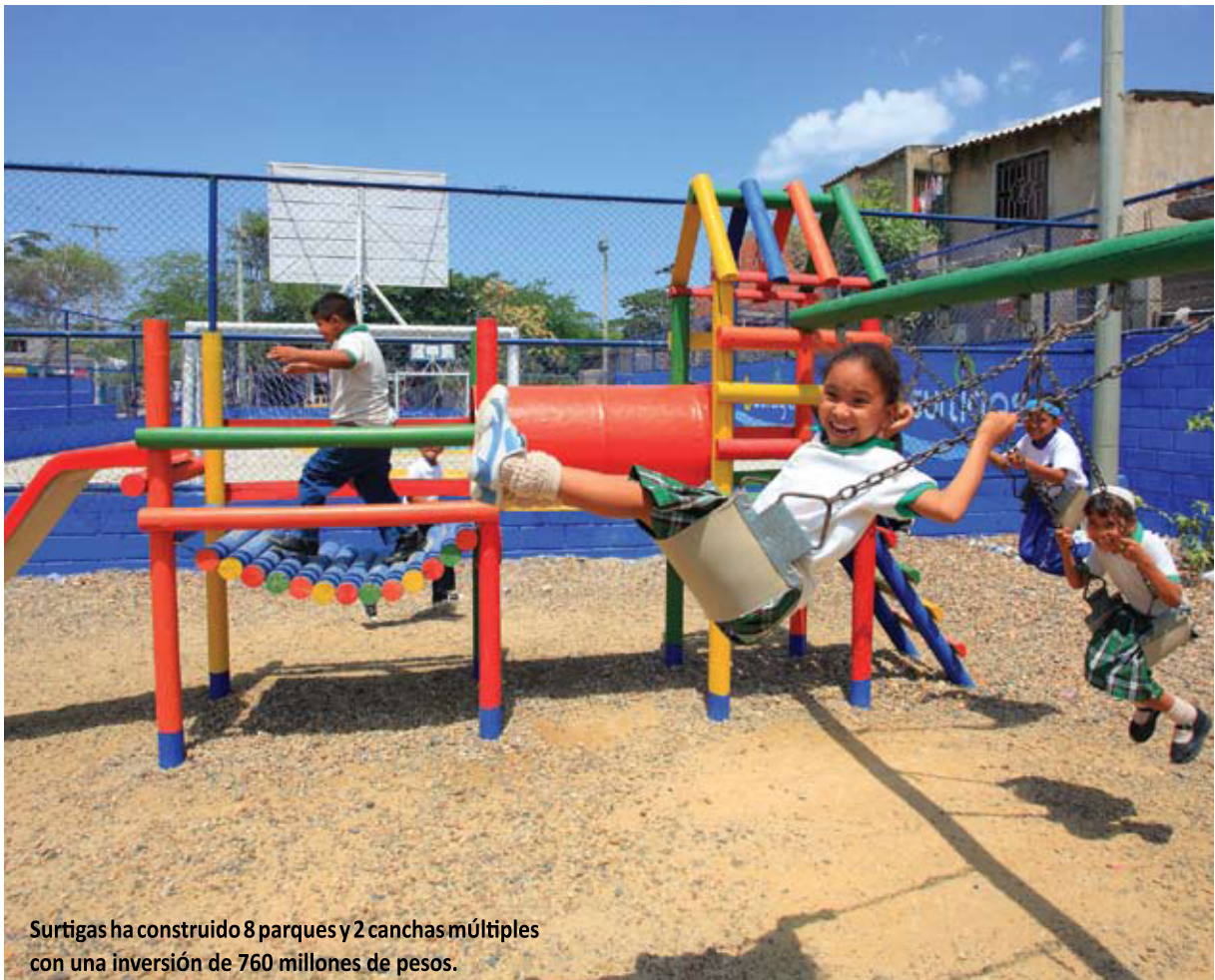
Surtigas ha construido 8 parques y 2 canchas múltiples con una inversión de 760 millones de pesos.

En el 2008 invertimos en programas de Responsabilidad Social $1.616.776.150, contribuyendo de esta manera con el desarrollo integral de nuestra región.