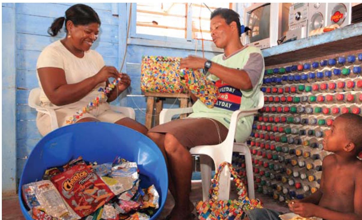
La Fundación Surtigas adelanta un programa de Empleabilidad en las Islas del Rosario.

Jóvenes con Valores Productivos es el programa de empleabilidad, que durante el 2009 atendió a 318 familias en Situación de Desplazamiento ubicados en Sincelejo y Ovejas, a las cuales se les apoyó con capital de trabajo para