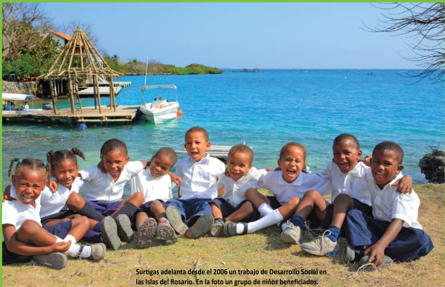
Surtigas adelanta desde el 2006 un trabajo de Desarrollo Social en las Islas del Rosario. En la foto un grupo de niños beneficiados.

Dentro de la Política Corporativa de Surtigas se encuentra explícito el enfoque de responsabilidad social que tiene hacia sus públicos de interés y de igual forma hace énfasis en la importancia que el público interno conformado por sus empleados tiene para la empresa. Durante el 2008 se hizo una revisión de la política y se incluyeron dos orientaciones nuevas: la de responsabilidad social y la de gestión ambiental, dos ejes temáticos de especial interés que revelan el valor que Surtigas imprime a estos temas.